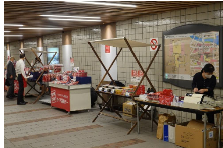
昨年度の実施状況